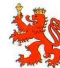
Uhlava (ČR), německé území - - bis zu fünf Gemeinden -

Na akčním území žije cca.24 000 obyvatel,z toho dvě třetiny na bavorské straně. V obcích Ekoregionu Arrach,Lam a Lohberg ..